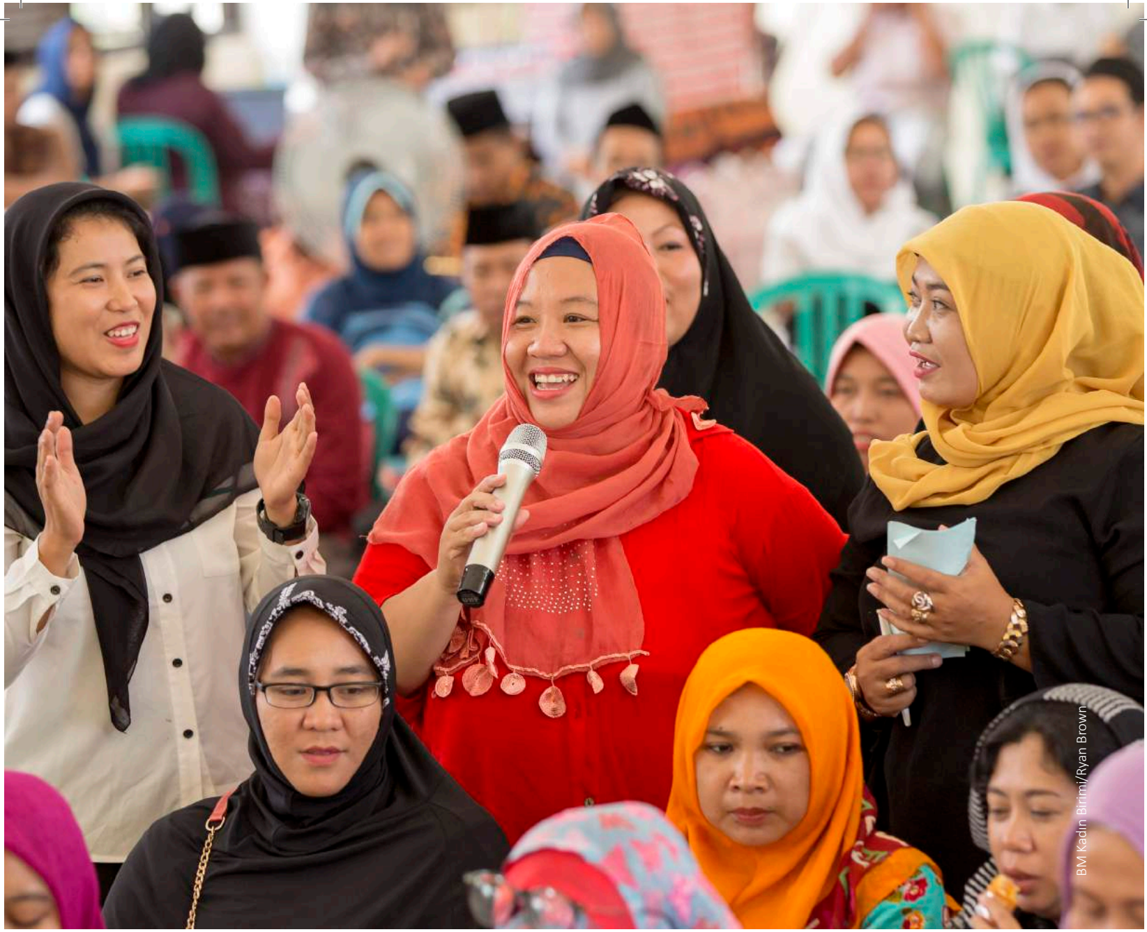
BM Kadın Birimi/Ryan Brown