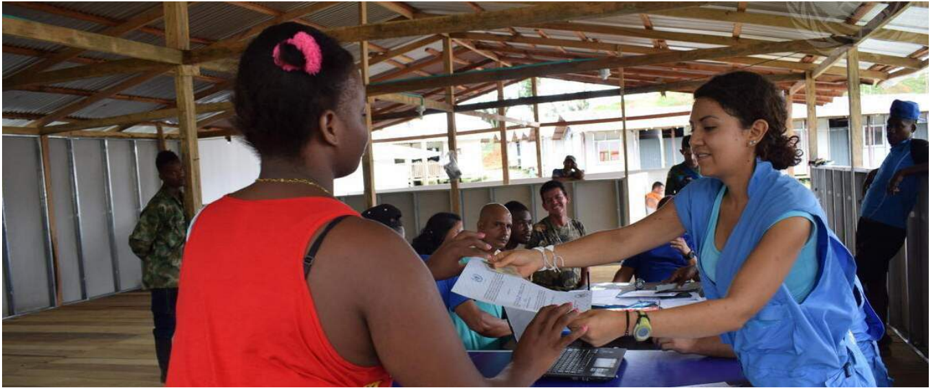
Dans le cadre du processus de réintégration dans la vie civile, les membres des Forces armées révolutionnaires de Colombie (FARC-PE) reçoivent des certificats pour avoir déposé leurs armes individuelles à la Mission de l'ONU en Colombie et une accréditation du Haut Commissariat du pays pour la paix.