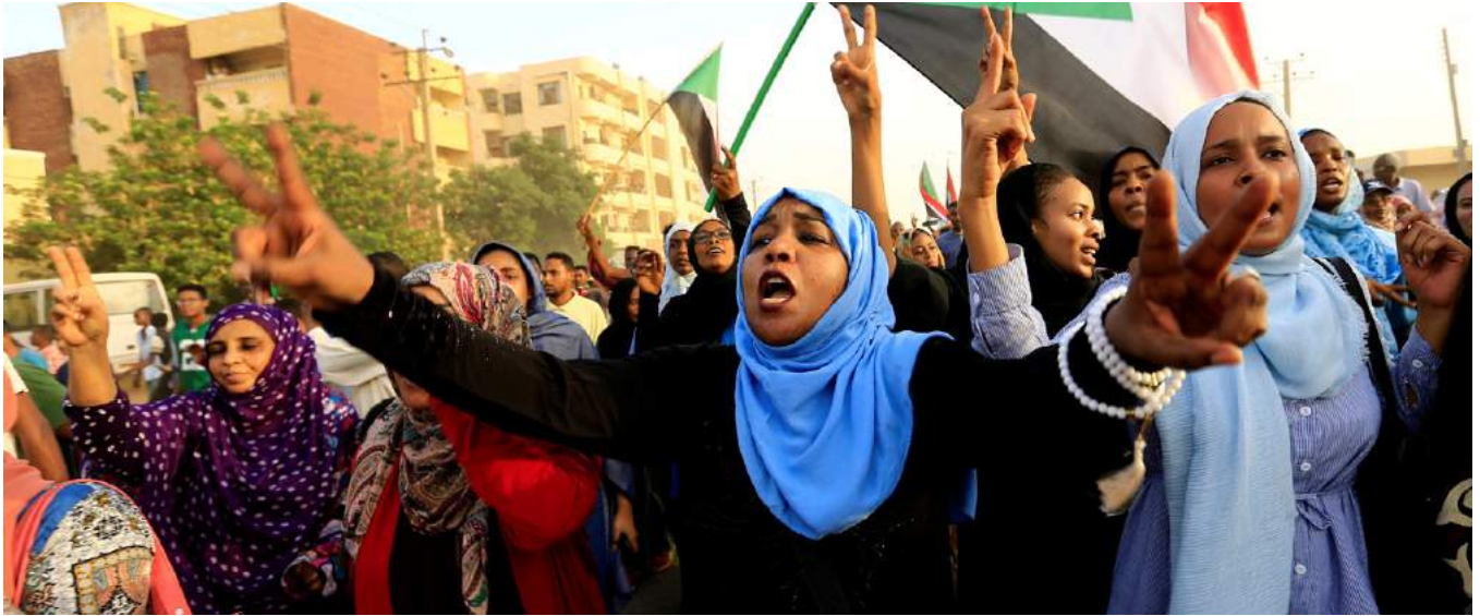
Des manifestants soudanais défilent lors d'une manifestation pour commémorer les 40 jours du massacre d'un sit-in à Khartoum Nord, Soudan, le 13 juillet 2019.